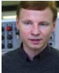
Aivar Sõerd Rahandusminister