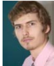
Ain Kivisaar Eastern Europe Real Estate Investment Trust